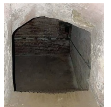
Dieser dunkle Raum liegt unter der Kapelle des Vöhlinschlosses.